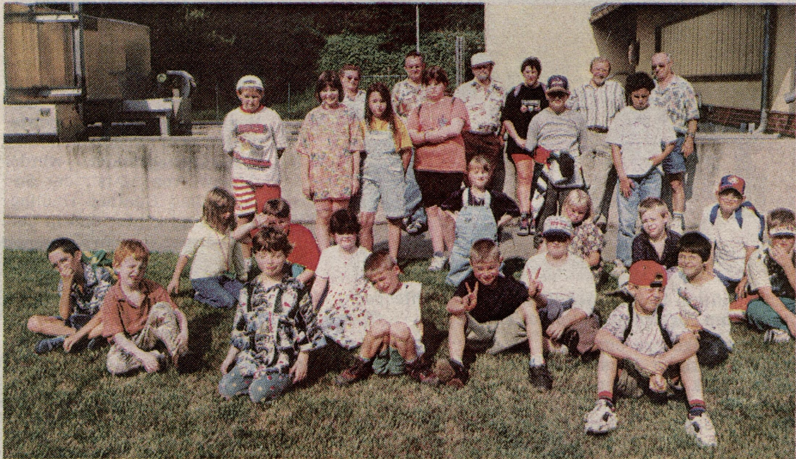
Die Kinder interessierten sich sehr für die Kläranlage.

Kinder durch die Anlage und erklärte ihnen die Funktion. Ein Blick durch das Mikroskop verdeutlichte den Jungen und Mädchen, wie sich die Reinigung vollzieht. An der Grillhütte klang der Tag bei Leckerem vom Rost aus.